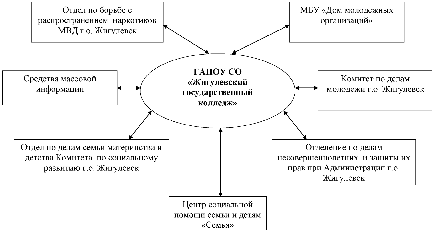
Рис. 2 Структура взаимодействия модели воспитательного процесса ГАПОУ СО «ЖГК» с внешними организациями г.о. Жигулевск.